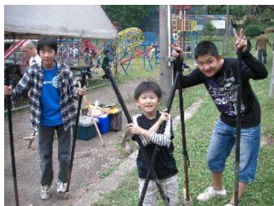
芋煮会会場で遊ぶ子供達

としてもとても良い環境といえるのではないだろうか。子供にとっても素晴らしい会であるので来年の芋煮会はさらに多くのご家族の参加をお待ちしております。